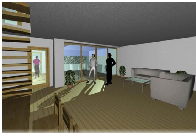
Kvasiny Jih Zámecká | Studie | Vizualizace - Interiér