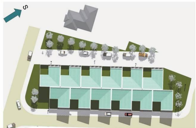
Kvasiny Jih Zámecká | Studie | Situace