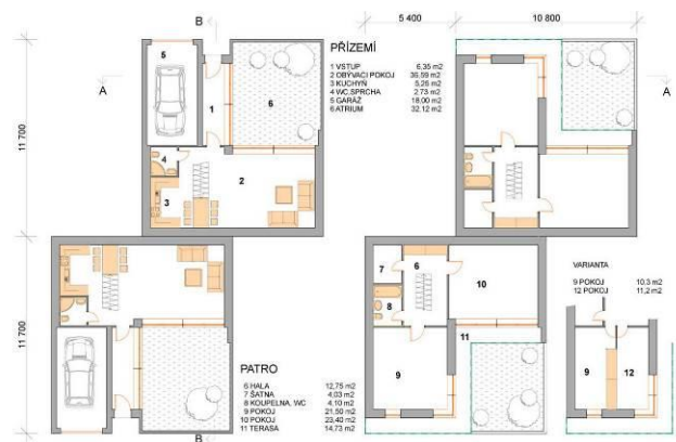
Kvasiny Jih Zámecká | Studie | Půdorys